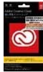
コンプリートプラン

この度は、大学生協で、アドビソフトカード版をご購入いただき、ありがとうございます。 この案内では、製品をお使いになる迄の手順および更新方法をお伝えします。