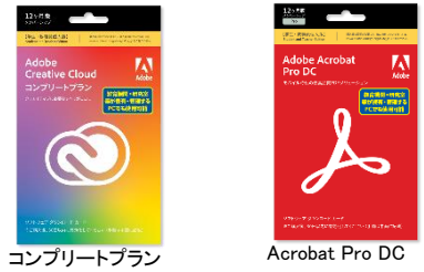
コンプリートプラン Acrobat Pro DC

この度は、大学生協で、アドビソフトカード版をご購入いただき、ありがとうございます。 この案内では、製品をお使いになる迄の手順および更新方法をお伝えします。